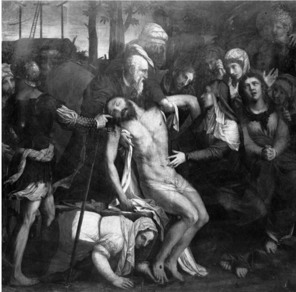
Charles Dorigny (La Rochelle ? - Paris 1551), Descente de Croix, 1548, huile sur bois (213 x 218 cm) signée et datée "Charles Dorigny/painctre 1546" sur la porte du tombeau. Etat antérieur à la restauration de 1969.