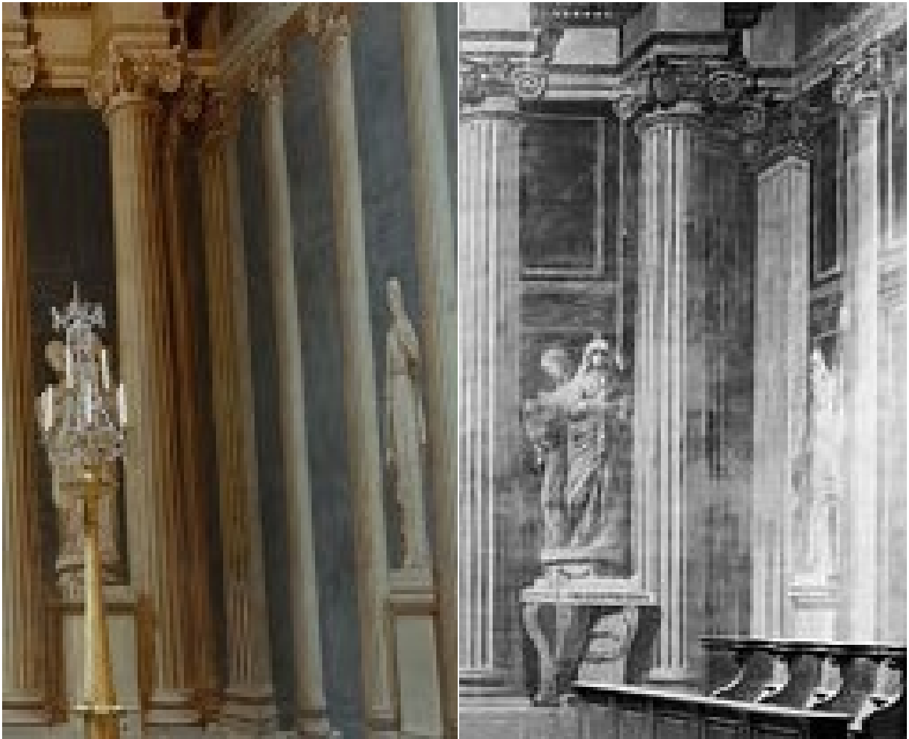
Montage confrontant l'état actuel de l'extrémité du du mur droit de la chapelle des âmes du purgatoire à l'état de la même zone avant la restauration des alentours de 1969.