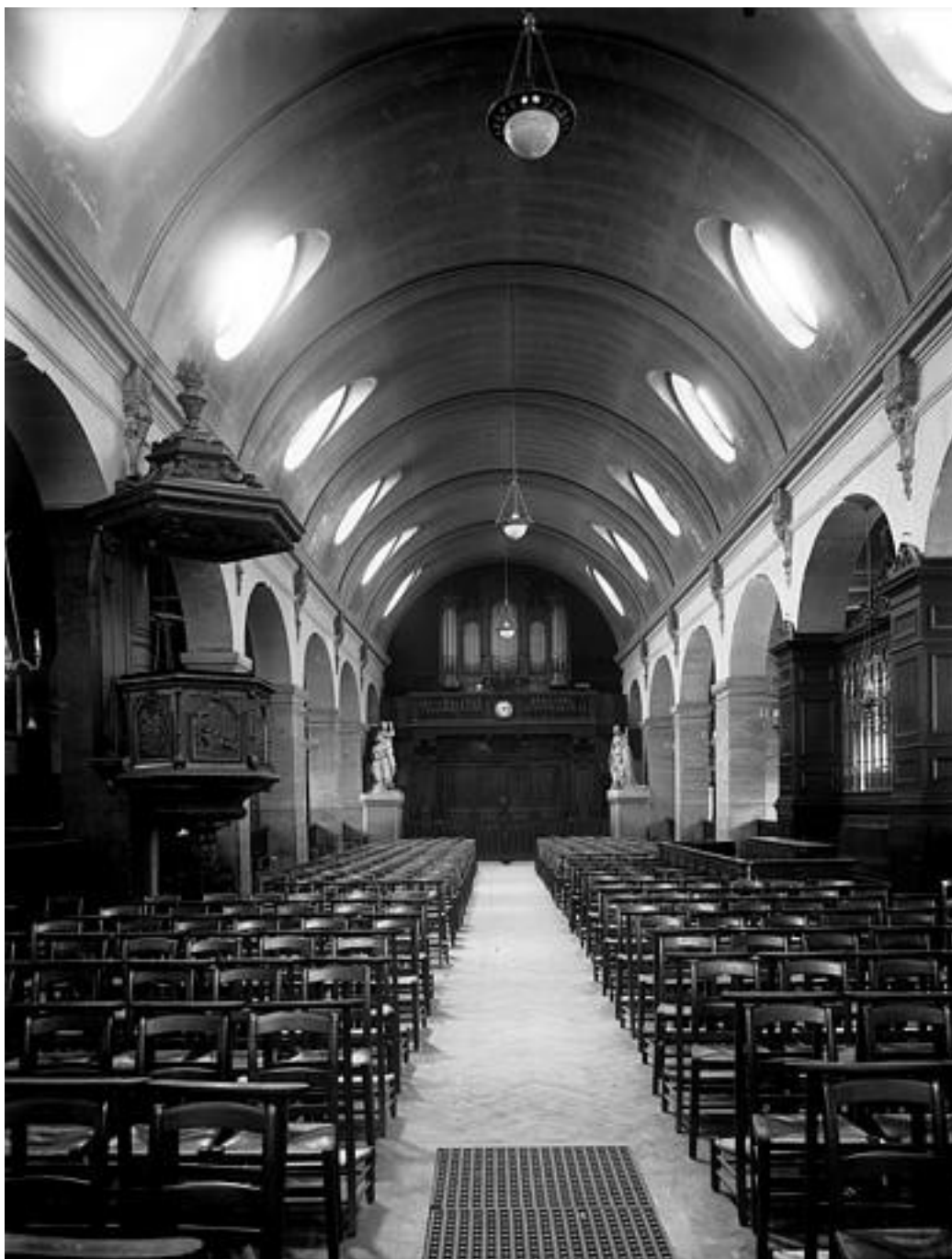
Paris, église Sainte-Marguerite : vue de la nef depuis le chœur. Cliché de Léger (prénom inconnu), avant 1969. ©Ministère de la Culture (France) - Médiathèque de l'architecture et du patrimoine.