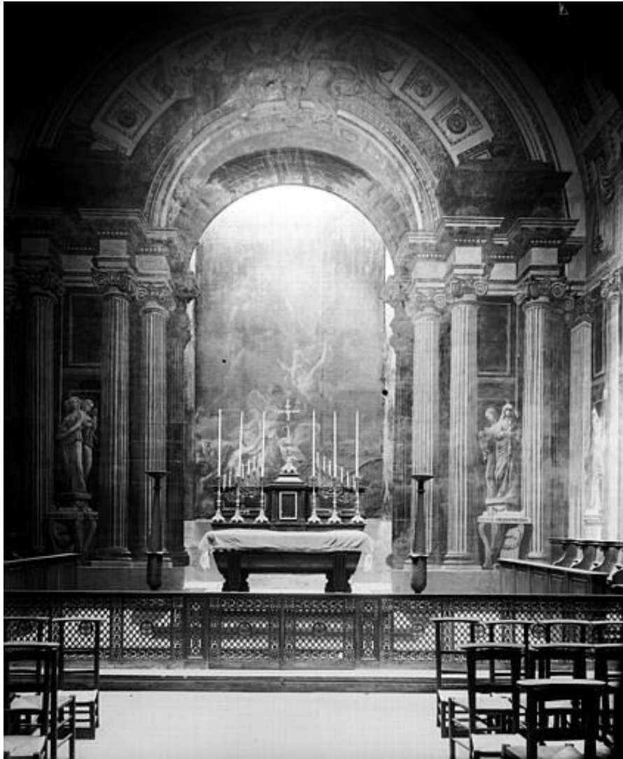
Léger (prénom inconnu), Vue intérieure de la chapelle des Âmes du Purgatoire de l'église Sainte-Marguerite avant 1969, ©Ministère de la Culture (France) - Médiathèque de l'architecture et du patrimoine.