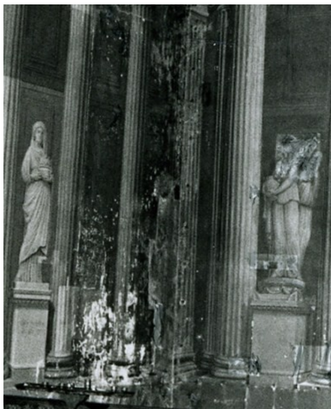
Jean-Christophe Doerr, Vue intérieure de la chapelle des âmes du purgatoires, 1998 / ©Jean-Christophe Doerr / Comité d'histoire de la Ville de Paris (CHVP)